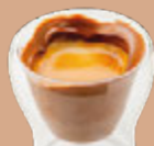
บูเทลล่า® เอสเพรสโซ

บูเทลล่า® เอสเพรสโซ 130 ฿ ครีมเฮเซลนัทและเอสเพรสโซ พิสตาชิโอ เอสเพรสโซ 130 ฿ ครีมพิสตาชิโอและเอสเพรสโซ แฟลตไวท์ร้อน 120 ฿ นม 60 ฿ ลาเต้ร้อน 160 ฿ ลาเต้เย็น 140 ฿ ชาให้เลือกหลากหลาย 150 ฿