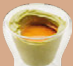
พิสตาชิโอ เอสเพรสโซ

เอสเพรสโซ มัคคิอาโต้ 90 ฿ เอสเพรสโซ มัคคิอาโต้ ใหญ่ 120 ฿ ดับเบิล เอสเพรสโซ 100 ฿ เอสเพรสโซเพิ่มวิปครีม 110 ฿ คาปูชิโน่ร้อน 120 ฿ คาปูชิโน่ร้อนเพิ่มเมลท์ช็อกโกแลต 130 ฿ เวลลูตาตา ดี คาเฟ่ 120 ฿ อเมริกาโน่ร้อน 80 ฿ กาแฟเย็น 120 ฿ คาปูชิโน่เย็น 140 ฿ อเมริกาโน่เย็น 100 ฿