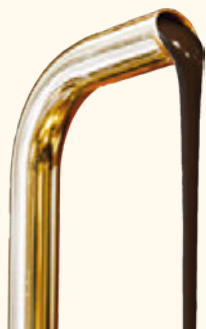
ดาร์กช็อกโกแลต 70%