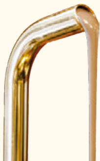
มิลค์ช็อกโกแลต 35%