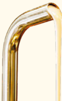
ไวท์ช็อกโกแลต