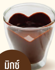
มีทซ์ ตามชอบ